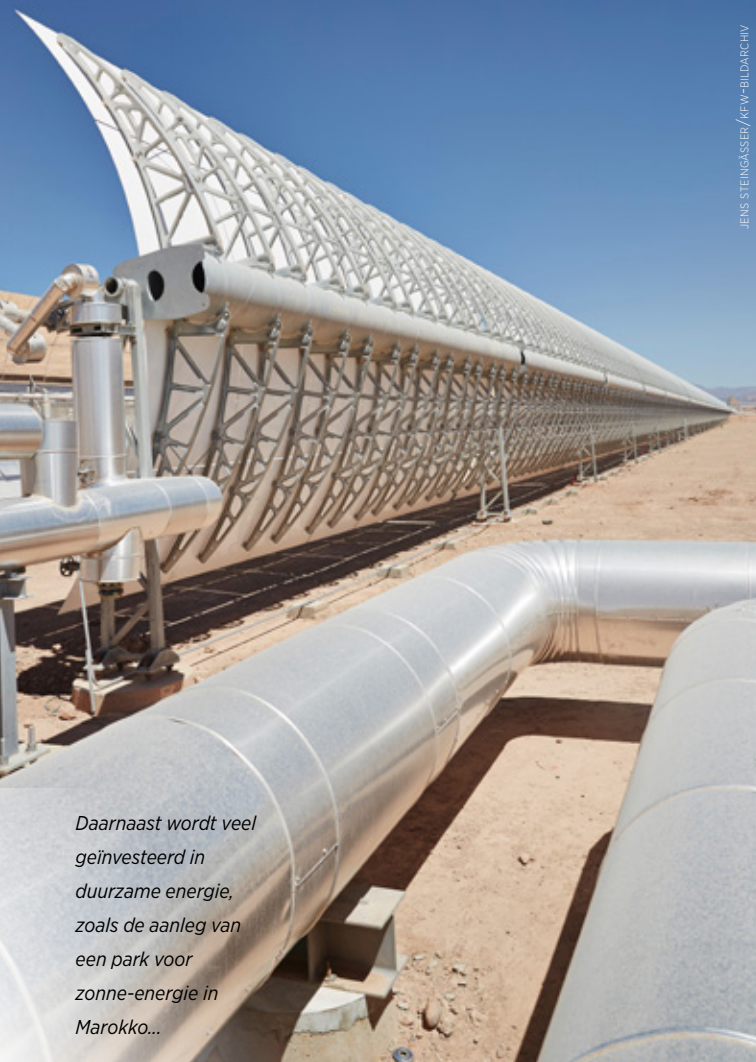
Daarnaast wordt veel geïnvesteerd in duurzame energie, zoals de aanleg van een park voor zonne-energie in Marokko...