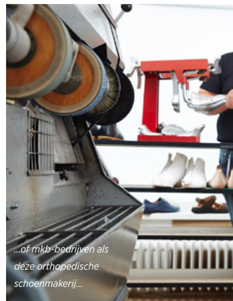
...of mkb-bedrijven als deze orthopedische schoenmakerij...

Hiermee kunnen consumenten zich een beeld vormen hoe het materiaal aanvoelt waarmee wij onze kasten, stoelen en tafels maken. En ze kunnen gelijk bepalen welke kleur de meubels moeten hebben.' In het vierde kwartaal van 2015 was de omzet volgens To opgelopen tot een miljoen euro met verkopen in meerdere landen, waaronder Nederland. 'Wij zijn de KfW Bank daarvoor grote dank verschuldigd.'