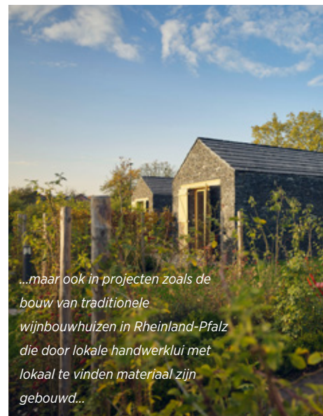
...maar ook in projecten zoals de bouw van traditionele wijnbouwhuizen in Rheinland-Pfalz die door lokale handwerklui met lokaal te vinden materiaal zijn gebouwd...